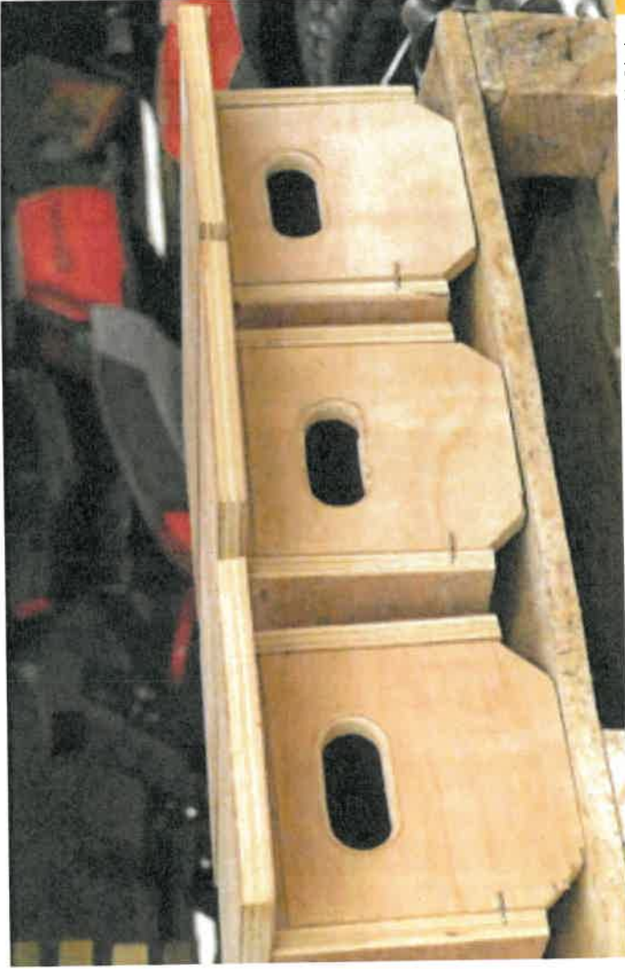
Nichoirs à martinet noir fabriqués par la menuiserie départementale de Saint-Pons

Les martinets sont coloniaux. Il est donc conseillé d'installer plusieurs nichoirs sur un même bâtiment.