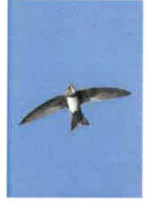
De gauche à droite : martinet pâle, martinet à ventre blanc, hirondelle rustique, hirondelle de fenêtre.