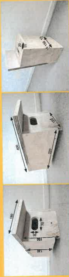
Toutes les longueurs sont en mm. L'épaisseur des éléments : 15 mm

Dans le cadre du dispositif départemental d'installation de nichoirs à martinet noir dans les collèges et communes volontaires, voici pour exemple les dimensions des nichoirs fabriqués par la menuiserie départementale de Saint-Pons, en suivant les recommandations de "Martinet noir : entre ciel et pierre. Cahier du MHNC n°15".