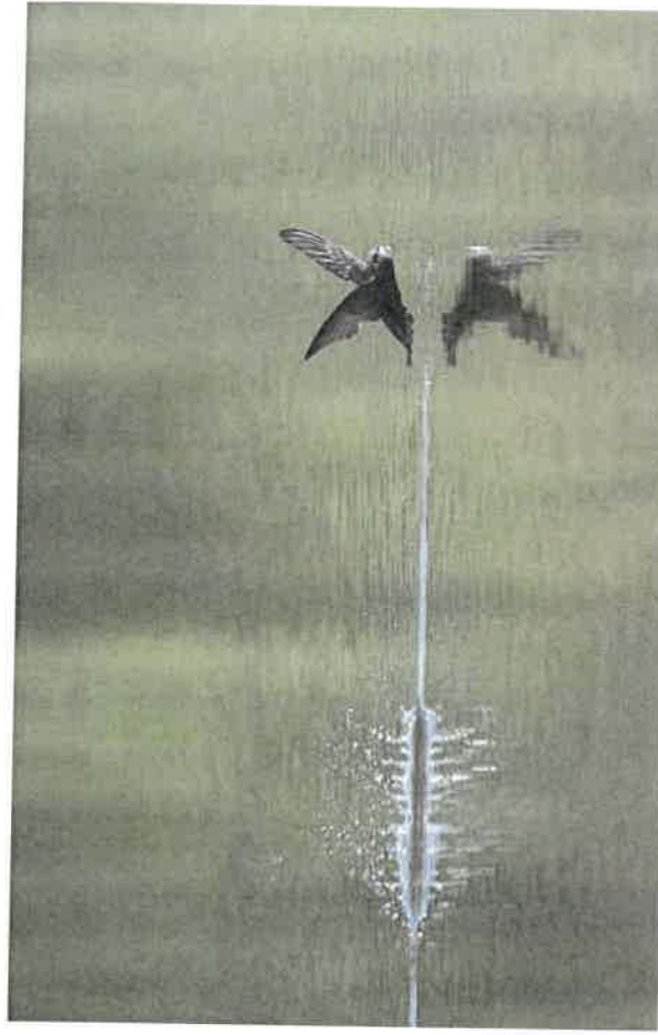
Martinet noir en train de boire tout en volant