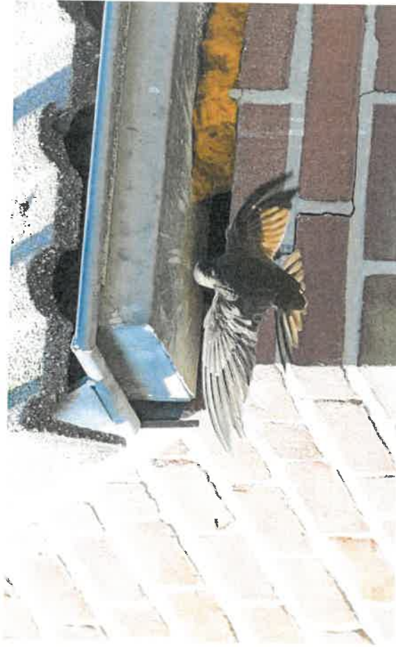
Martinet noir nichant dans une cavité sous le toit d'un bâtiment